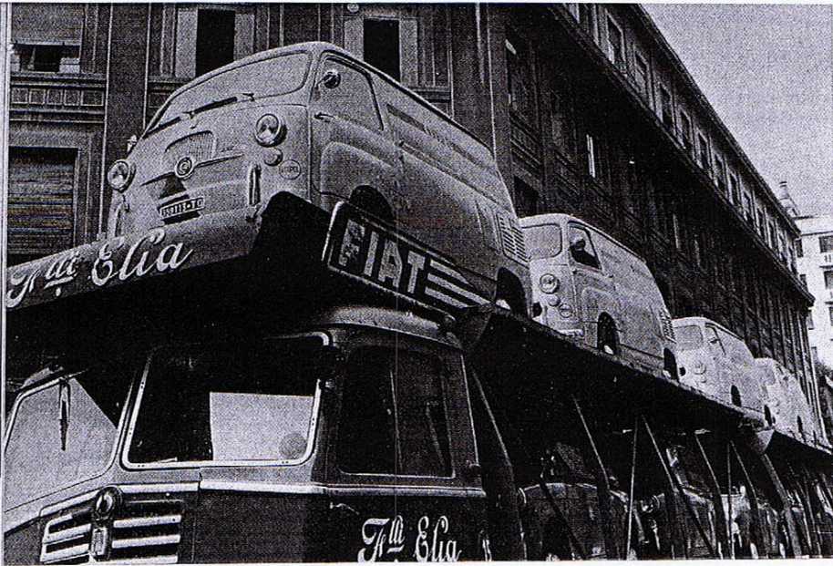
Un autotreno, carico di automezzi, appena giunto alla Centrale Romana.