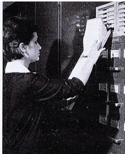
Il «cardex» del personale autorizzato alla guida degli autoveicoli sociali e propri.